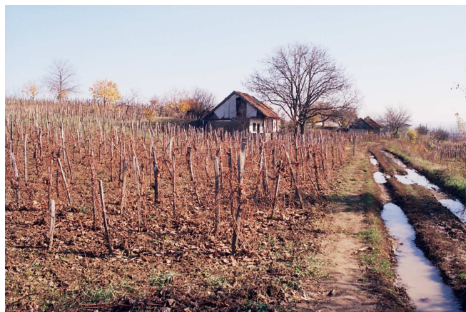
Cultura de struguri

În comuna Saniob sunt vinuri locale oficial controlate (DOC). Tipurile de vinuri autohtone sunt: Furmint, Fetească Albă, Fetească Regală, Riesling și Mustoasă de Mădăras. Există și un concurs al celor mai bune vinuri locale.