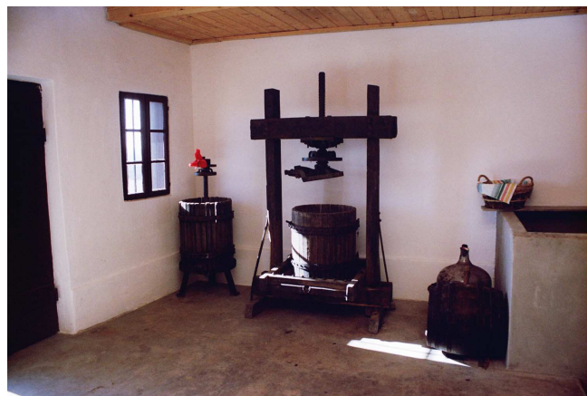
unealta de stors struguri

La capitolul creșterea animalelor, în comuna Saniob predomină creșterea porcinelor și a bovinelor. În ultimii ani se constată o scădere marcantă a efectivelor de