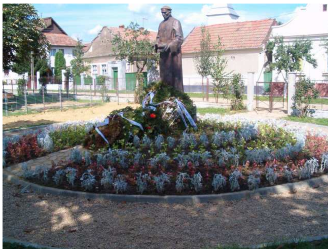
Statuia abatelui Mercurius

În localitatea Sâniob s-a realizat un parc cu bănci și locuri de joacă, cu iluminare pe timp de noapte în centru căruia s-a ridicat statuia lui Mercurius , abatele care a adus mâna dreaptă a regelui „ Szent Istvan”.